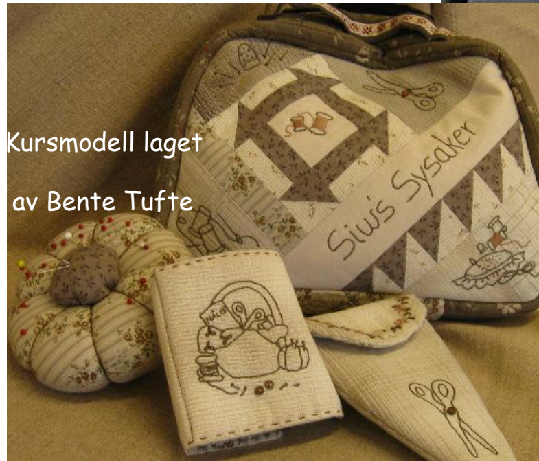
Kursmodell laget av Bente Tufte