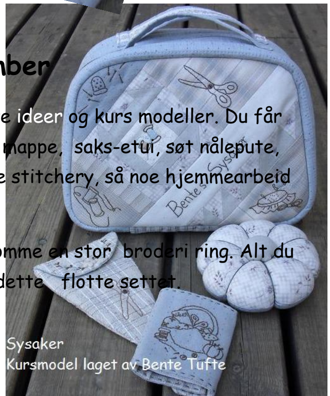
Sysaker Kursmodell laget av Bente Tufte